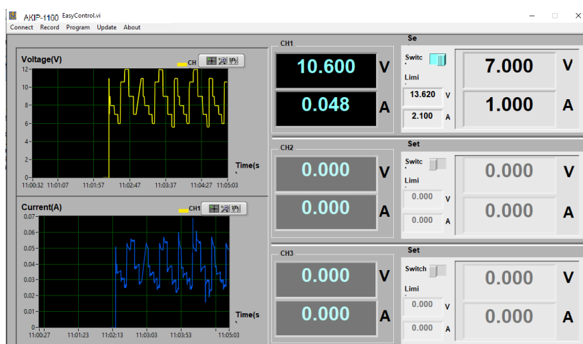
Интерфейс ПО Easy Control